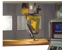
Usinage de nid d'abeilles