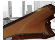
Moule de construction légère avec élément de nid d'abeilles