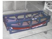
Mise en forme de nid d'abeilles