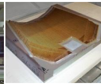
Élément de nid d'abeilles usiné et mise en forme des deux côtés