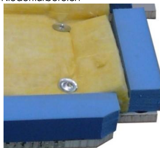
Detailansicht der Unterseite